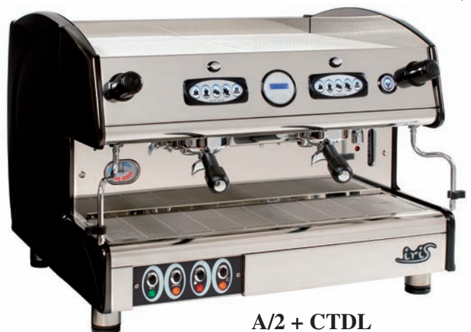
A/2 + CTDL

Aufgrund der zahlreichen angebotenen Modelle (automatisch 4 oder 6 Tassen, halbautomatisch, economy, mit Druckkolben usw.) sowie der Möglichkeit die Maschine durch Zusatzgeräte zu erweitern (automatische Kontrolle der Dampfdrüse, Speicherung und Eingabe der Kaffeemengen über digitale Tastatur, PID-Kontrolle der Kesseltemperatur, Kontrolle der Maschinenparameter usw.) ist die Produktserie la SCALA einer der Spitzenreiter unter den Espressomaschinen „Made in Italy“.